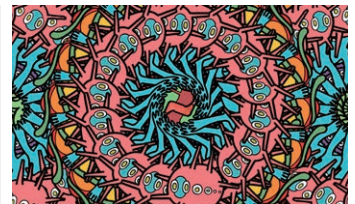
Poker , MIZUE Mirai / NAKAUCHI Yukie @MIRAI FILM