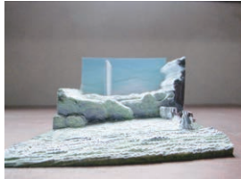
kiokuzenkei , YOKOTA Masashi @masashi_yokota