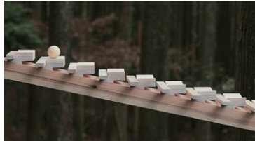
Xylophone , HARANO Morihiro / NISHIDA Jun / HISHIKAWA Seichi / MATSUO Kenjiro / TSUDA Mitsuo / OISO Toshifumi @ NTT DOCOMO, INC.