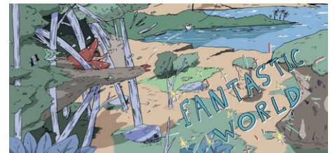
Fantastic World, HIRANO Ryo @LEED PUBLISHING CO., LTD @ryo hirano / FOGHORN

Un teleférico va y viene enlazando las montañas y un lugar turístico flota en el aire rural de algún lugar. Lo que aparece allí es una mujer que cambia de forma en una oreja, un hombre amarillo totalmente desnudo, un gato y una salamandra que camina como un hombre. Hay descripciones insertas en el espacio-tiempo; por un lado, en un eje vertical, el ciclo del agua: mientras fluye, alguien bebiéndola, la lluvia cayendo del cielo, las olas acercándose en un lago; y en el eje horizontal, un sentimiento de anhelo con una mujer hundida en la nostalgia, nerviosismo, un choque. Todo ello es una invitación a la simpatía inolvidable, pero también algo inexplicable para quien lo contempla.