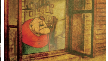
The House of Small Cubes , KATO Kunio @ROBOT

Visita guiada 23 Enero (Sábado) 13:00— | Lugar: Matadero Madrid, Nave 16