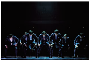
WORLD ORDER in BUDDOKAN

"Entrada libre hasta completar el aforo"