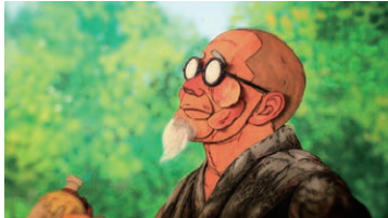
I am alone, walking on the straight road... , OKAMOTO Masanori @OKAMOTO Masanori / Tokyo University of the Arts

"Entrada libre hasta completar el aforo"