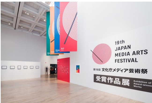
平成27年度[第19回]文化庁メディア芸術祭受賞作品展

優れたメディア芸術作品を紹介するため、海外のメディア芸術関連のフェスティバル・施設において、文化庁メディア芸術祭の受賞作品を中心とした企画展の開催やパッケージプログラムの上映、専門家によるプレゼンテーション、作家によるワークショップ等を実施しています。企画展では、企画ディレクターがテーマに基づいた作品キュレーションを行い、現地参加先と共同で展覧会を開催しています。