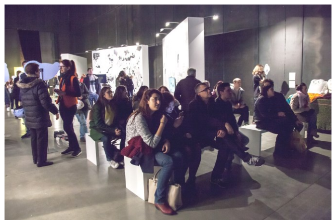
海外メディア芸術祭等参加事業(マドリッド企画展2016)